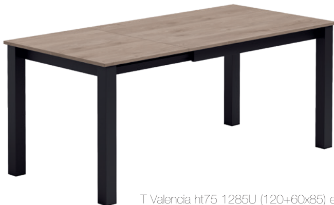
T Valencia ht75 1285U (120+60x85) ep01 ...